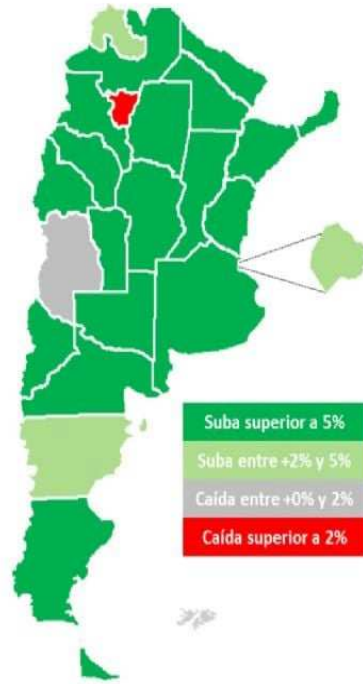
Mapa I. Variación del empleo registrado en el sector privado según provincias. Periodo Feb20 – Mar23. Serie desestacionalizada.